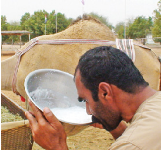
شرب الحليب النيئ من أهم طرق الإصابة بالبروسيلة.