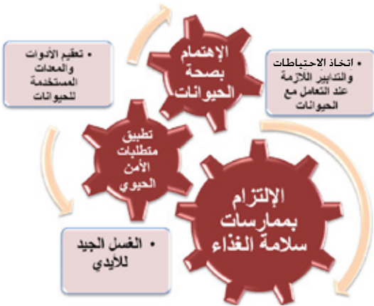
شكل يوضح متطلبات الوقاية من الأمراض المشتركة.