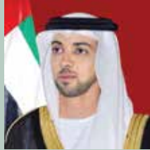
سمو الشيخ منصور بن زايد آل نهيان نائب رئيس مجلس الوزراء وزير شؤون الرئاسة - رئيس مجلس إدارة الهيئة