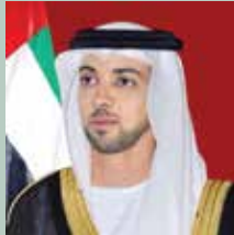
H.H. Sheikh Mansour bin Zayed Al Nahyan Deputy Prime Minister - Minister of Presidential Affairs - Chairman