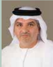
سعادة راشد عبدالكريم البلوشي وكيل دائرة التنمية الاقتصادية