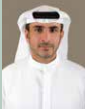
سعادة خليفة محمد المزروعي وكيل دائرة النقل