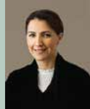
معالي مريم بنت محمد المهيري وزيرة دولة - ملف الأمن الغذائي