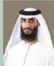
سعادة مبارك عبيد الظاهري وكيل دائرة التخطيط العمراني والبلديات